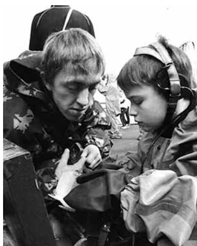
Мы – связисты!