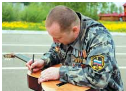
Автограф на память.