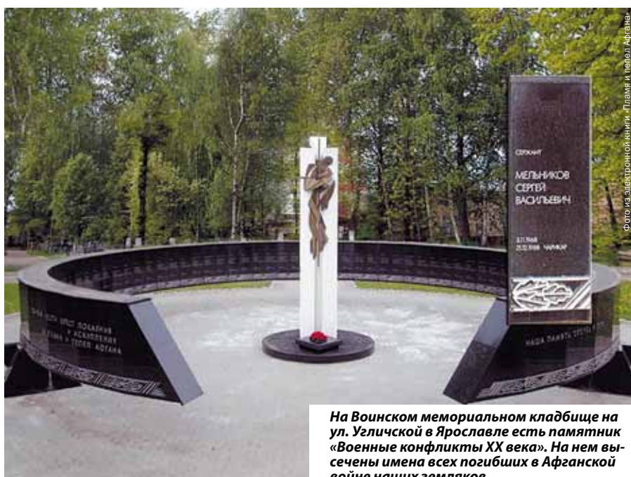
На Воинском мемориальном кладбище на ул. Угличской в Ярославле есть памятник «Военные конфликты XX века». На нем высечены имена всех погибших в Афганской войне наших земляков.