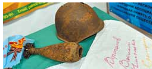
Находки центра «Патриот».

мы и с Героем России ярославцем Алексеем Чагиным. Он часто бывает у нас в гостях. На территории нашей школы действует общественная организация «Отряд «Рысь», где будущие полицейские изучают тонкости трудной профессии. Более тридцати наших ребят имеют специальные удостоверения «Юный друг полиции России».