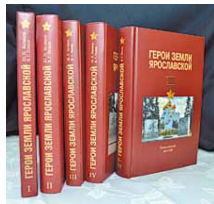
Книга «Герои земли Ярославской» передана во все районы области.