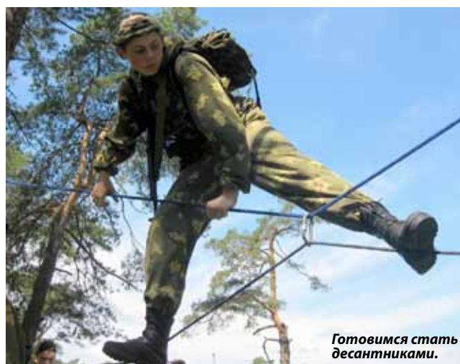
Готовимся стать десанниками.