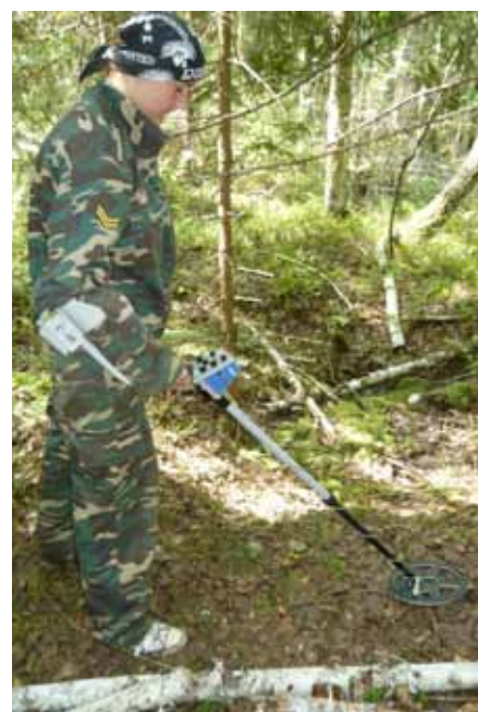
Металлоискатель – хороший помощник поисковика.

Первые годы своего существования все раскопки переславские пои-