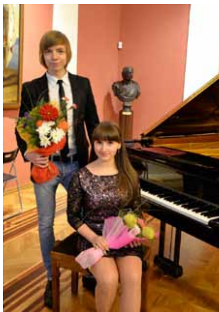
Присуждение звания лауреата госпремии по поддержке талантливой молодежи в рамках национального проекта «Образование». Губернаторский дом. Ярославль. 2013 год.