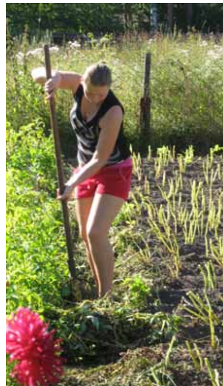
Ребята и грядки в порядок приведут...