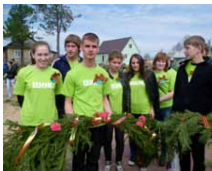
Поклонимся великим тем годам...

Для повышения престижности волонтерского дела, а также чтобы среди ребят рос здоровый дух соперничества, в Рыбинском районе ежегодно проводится муниципальный конкурс «Волонтер». Прошел он и в этом году. Одна из номинаций – «Лучший волонтер-наставник». Впервые в 2013 году