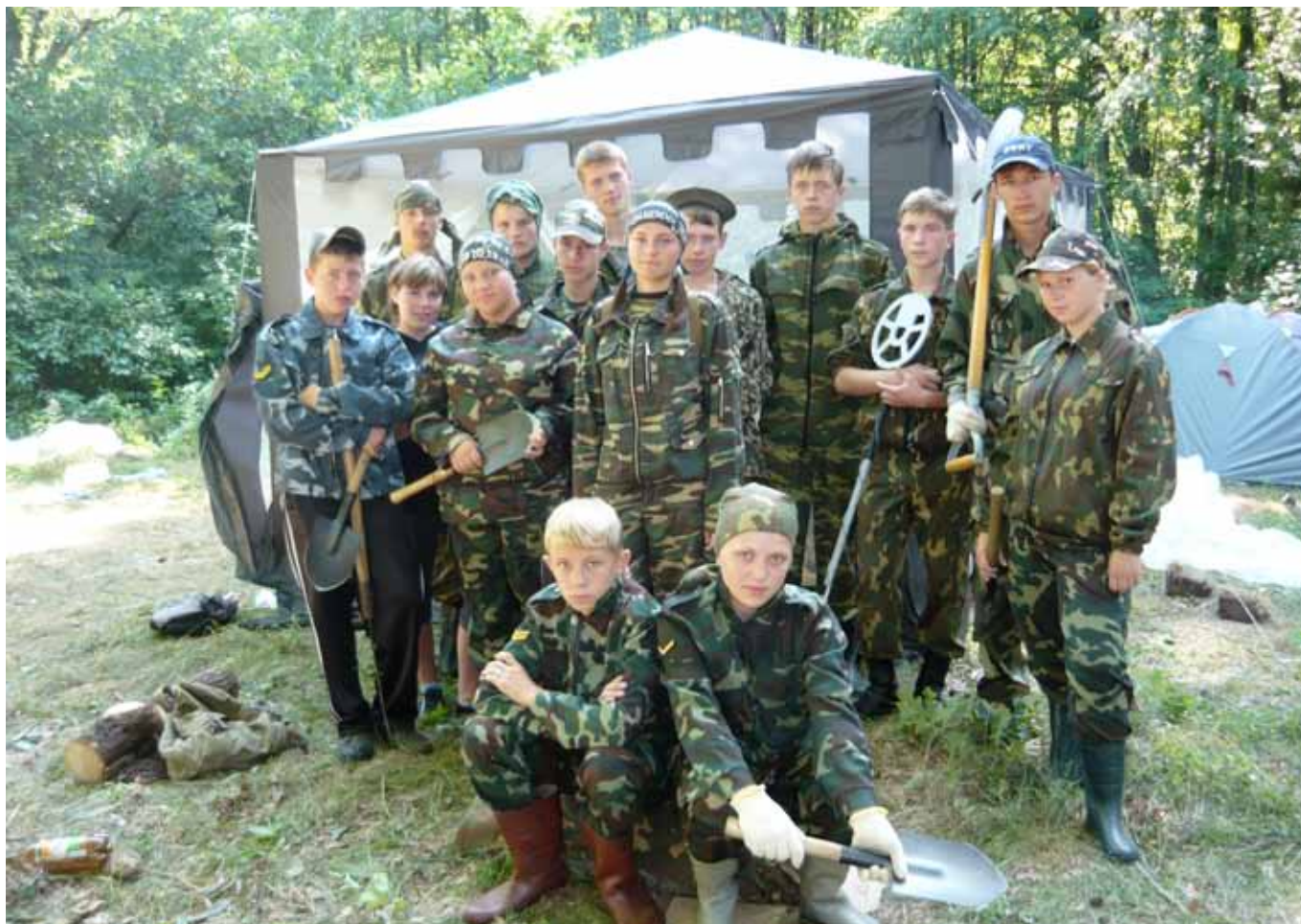
Члены поискового отряда «Ярославец» на Вахте Памяти, 2013 г.