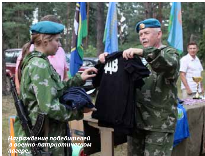
Награждение победителей в военно-патриотическом лагере.