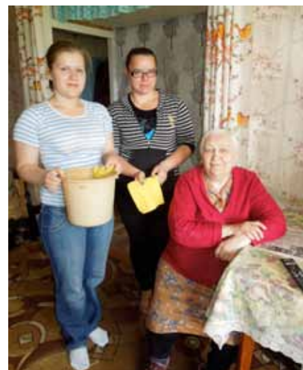
...и в доме помогут убраться.

Поиском ответа на этот и множество других вопросов теперь занимается не только районный совет ветеранов, но и наши ребята. И, надо отметить, у молодежи это неплохо получается. ★