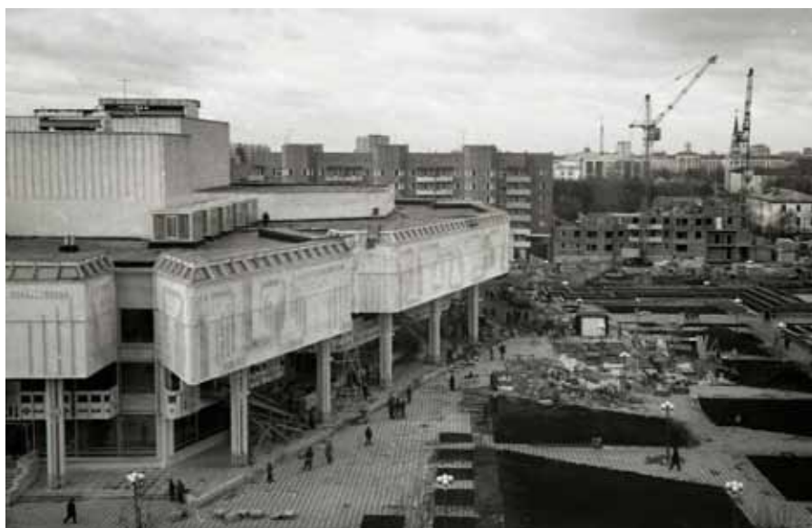
Идет строительство ТЮЗа.