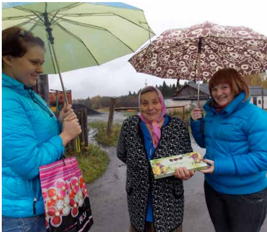
Акция «Тепло души».

старшеклассников растет популярность «Школы добровольцев». В июле этого года в ее работе приняли участие 28 человек – волонтеры Рыбинского муниципального района в возрасте от 14 до 17 лет. Участники лагеря, молодые активисты, получили возможность обменяться опытом работы в поселениях, проявить себя в различных моделях взаимодействия, познакомиться с новыми приемами и методиками работы, пополнить творческую копилку добрых дел.