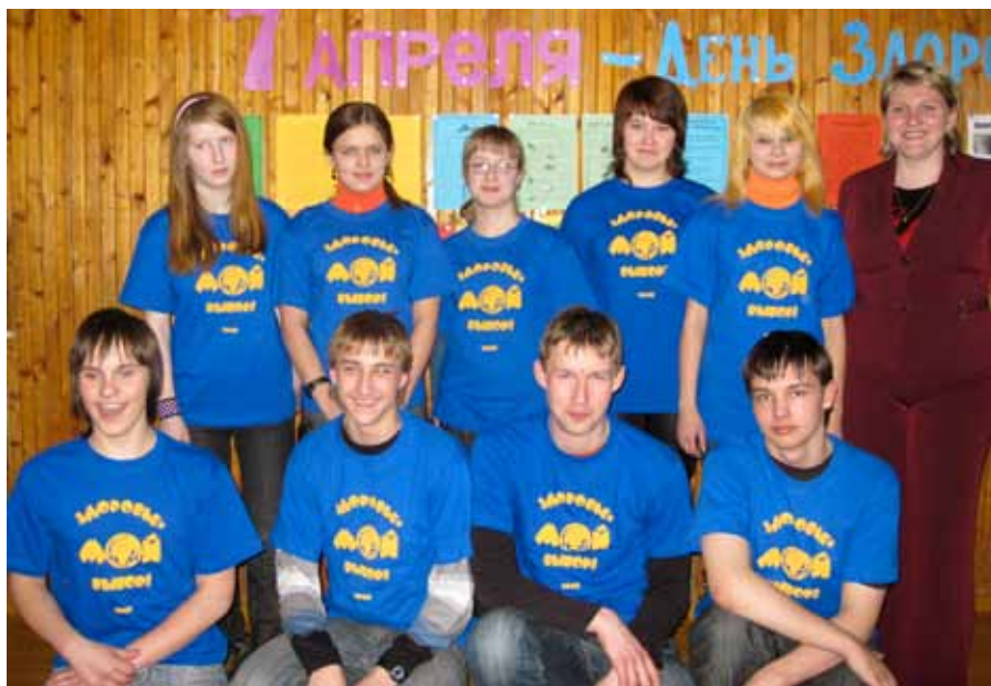
Вот такие волонтеры в Рыбинском районе.

Вскопать огород, собрать урожай, покрасить стены или побелить потолки, привезти и нарубить дров – все эти хозяйственные дела без лишних напоминаний выполняют волонтеры из муниципального учреждения Рыбинского муниципального района «Социальное агентство молодежи». Там уже шестой год подряд силами энтузиастов самых разных возрастов реализуется программа «С заботой о ветеранах».